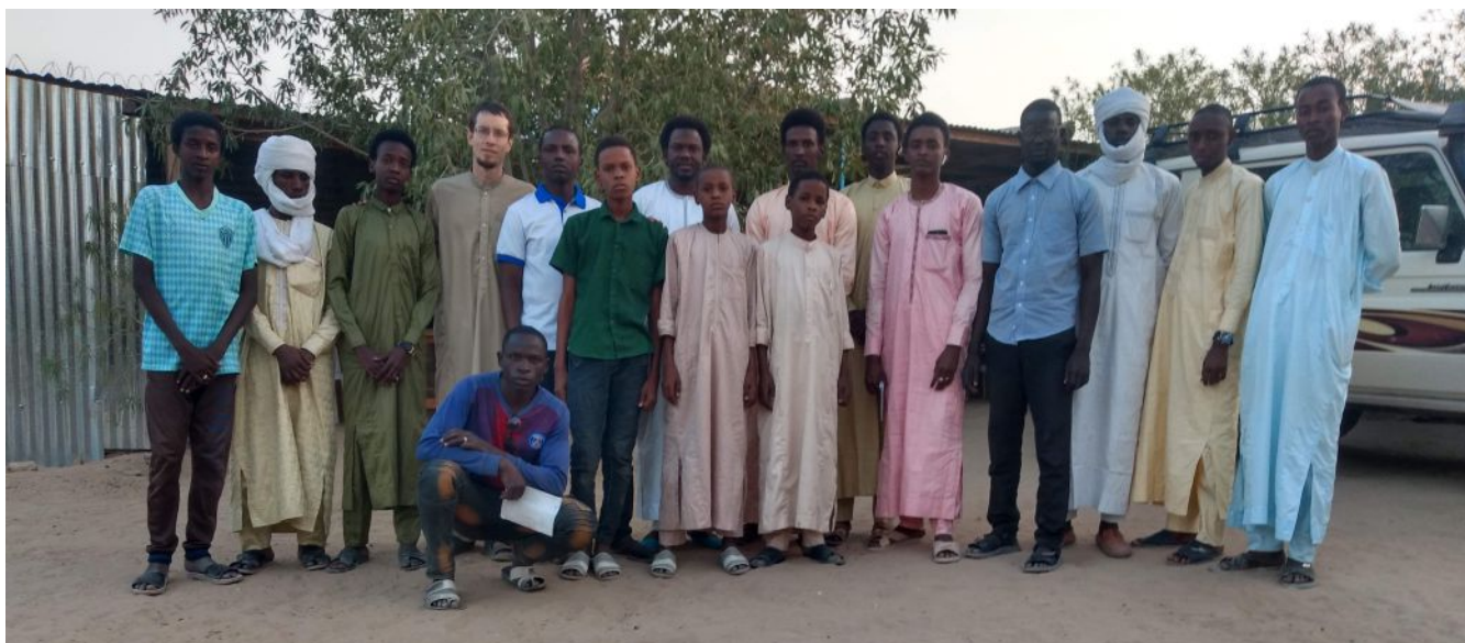
Photo de famille à la fin de cours IT-102 en février 2021

Le lieu d'enseignement actuel consiste à un hangar avec des tableaux, chaises et tableaux noirs. Un terrain avec trois chambres a été identifié en 2021 pour un nouveau lieu d'enseignement pour l'association. En 2022, les cours doivent être lancés dans ce nouveau lieu.